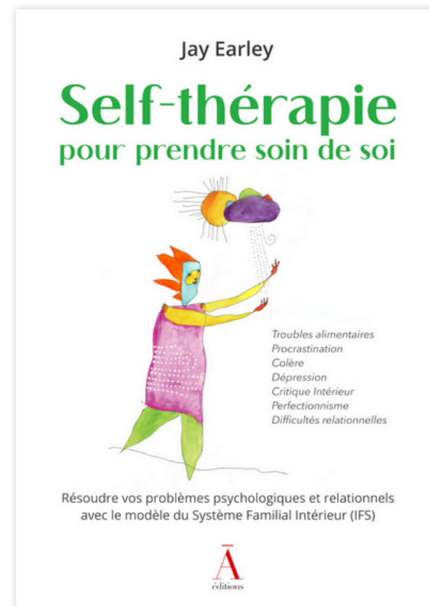
3 – Self-Thérapie, pour prendre soin de soi de Jay Earley